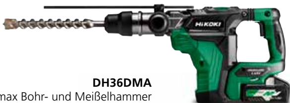
DH36DMA SDS-max Bohr- und Meißelhammer

Es gibt Jobs bei denen Sie etwas mehr Power benötigen? Unser MULTI VOLT BSL36B18 Akku und der Adapter ET36A bieten Ihnen die Leistung die Sie benötigen.