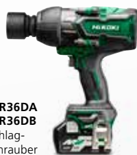
WR36DA WR36DB Schlag-schrauber