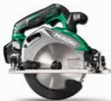
C3605DA | C3606DA | C3607DA Kreissägen