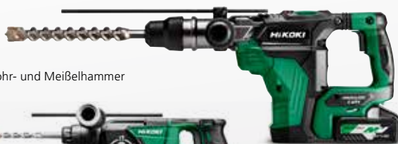
DH36DMA SDS-max Bohr- und Meißelhammer