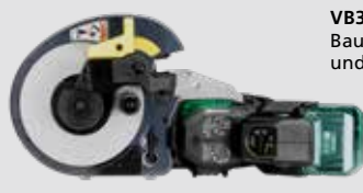
VB3616DA Baustahl Schneid- und Biegegerät