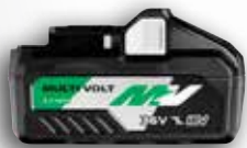
BSL36B18 MULTI VOLT Akku

Sie haben die Wahl zwischen unserer kabelgebundenen Tischkreissäge C10RJ oder der Akku Variante C3610DRJ. Sollten Sie Wert auf hohe Flexibilität legen, sind sie mit unserer C3610DRJ auf der sicheren Seite. Eine der einzigartigen Eigenschaften unserer neuen 36V Akku-Tischkreissäge ist, dass sie mit unserem MULTI VOLT Akku-System betrieben wird. Sollten Sie aber einmal 230V verwenden wollen, können Sie einfach den leistungsstarken MULTI VOLT AC/DC Adapter ET36A (optionales Zubehör) verwenden. Unabhängig davon, ob Sie sich in der Nähe einer Steckdose befinden oder nicht, können Sie mit der C3610DRJ überall die höchste Leistung erzielen.