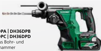
DH36DPA | DH36DPB DH36DPC | DH36DPD SDS-plus Bohr- und Meißelhammer